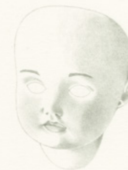
una cabeza de muñeca