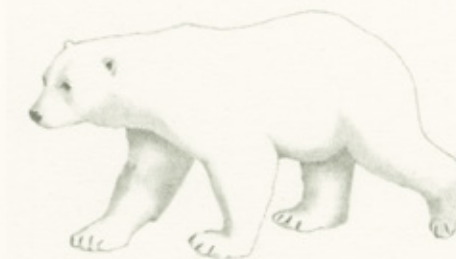
un oso polar