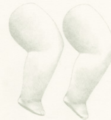
unas piernas de muñeca