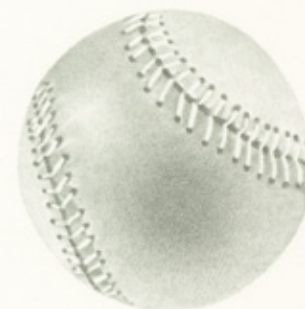
una pelota de béisbol