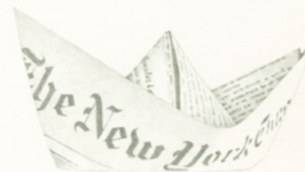
un barco de papel